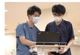
OJTによる個別指導 (On-the-Job Training)