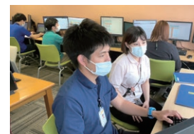
チェックリストを用いた スキルチェック(カリキュラム)