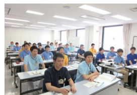
オリエンテーション (院内・チーム)

各チーム別にオリエンテーション、スキルチェック(カリキュラム)が用意されている!