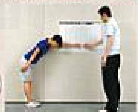
検査員が、検査員として行います。