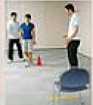
検査員が、検査員として行います。