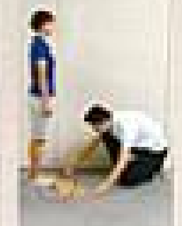
検査員が、検査員として行います。