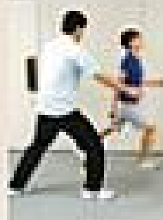
検査員が、検査員として行います。