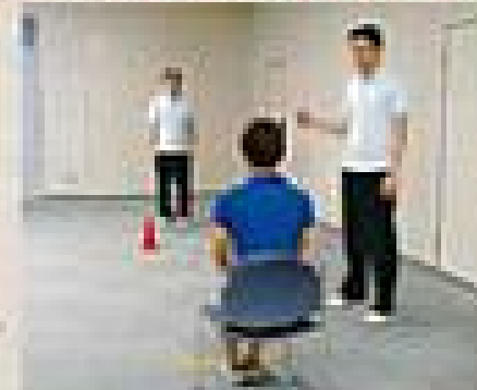
検査員が、検査員として行います。