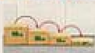
検査員が、検査員として行います。