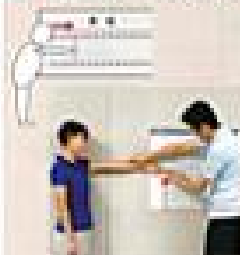
検査員が、検査員として行います。